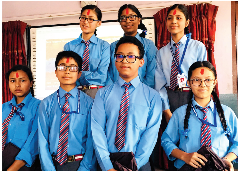
■ विश्व वातावरण दिवसको अवसरमा मेधा उच्च माध्यमिक विद्यालयमा आयोजित वक्तृत्वकला प्रतियोगितामा सहभागी विद्यार्थीहरू

संभव भएसम्म प्लाष्टिकको प्रयोग कम गर्न, पुनःप्रयोग गर्न र पुनःचक्रीकरण अर्थात् recycle गर्नुपर्ने बताउनुभएको थियो । वक्ताहरूले प्लाष्टिक जलाउँदा निस्कने धुवाँले गर्दा क्यान्सर र दमको रोगसमेत लाग्नसक्ने बताउनुभएको थियो । दिवसको नारा प्लाष्टिक प्रदूषणमाथि विजय प्राप्त गरौं: यदि पुनःप्रयोग गर्न सकिँदैन भने प्लाष्टिकको प्रयोग नगरौं भन्ने नारालाई आत्मसात् गर्दै सहभागी वक्ताहरूले प्लाष्टिकका उत्पादनहरू बग्दैबग्दै नदी, खोला, सागर र समुद्रहरूसम्म पुग्ने र विभिन्न जलचरहरूको अस्तित्व नै संकटमा पार्ने गरेको स्मरण गराउनुभएको थियो । उहाँहरूले सम्पूर्ण मानवजातिलाई दिवसको नारालाई व्यवहारमा उतार्न आग्रह गर्नुभएको थियो ।