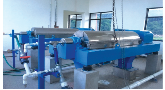
गृह्येश्वरीस्थित फोहर पानी प्रशोधन केन्द्रमा जडान गरिएको सेन्ट्रिफ्युज

day head tank मा पोलिइलेक्ट्रोलाइटको घोल तयार पार्नुहोस्) । संचालनको क्रममा संचालन तथा मर्मत टोलीले विद्यमान ठोस फोहरयुक्त पानी अर्थात् sludge को उत्पादन दर हेरी डोजको मात्रा र पोलिडोजिङको गाढापन अर्थात् concentration निर्धारण गर्नेछ