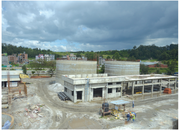
■ गुह्येश्वरीमा निर्माणाधीन फोहर पानी प्रशोधन केन्द्र अन्तर्गतका संरचनाहरूको एक फलक